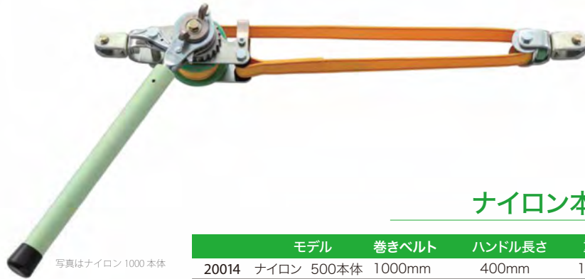
写真はナイロン1000本体

ベルトには感電リスクの少ない絶縁ナイロンを使用 ハンドルも絶縁性の高いFRPを採用